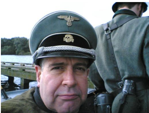
Hauptsturmbannführer von Braunschweig in Snuf de Hond (oktober 2007)